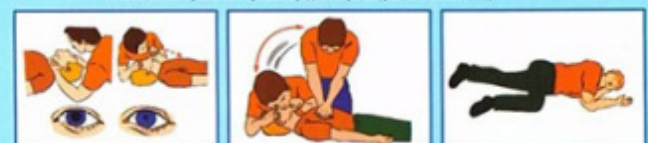
6. Если пульс, дыхание и реакция зрачков на свет отсутствуют - немедленно приступай к сердечно-легочной реанимации. Продолжай реанимацию до прибытия медицинского персонала или до восстановления самостоятельного дыхания и кровообращения. 7. После восстановления дыхания и сердечной деятельности придать пострадавшему устойчивое боковое положение. Укрой и согрей его. Обеспечь постоянный контроль за состоянием!

По статистике главными причинами гибели людей на воде являются: