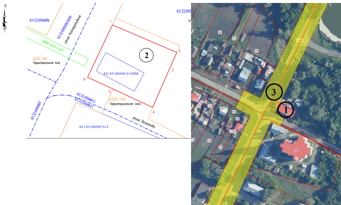
СХЕМА РАСПОЛОЖЕНИЯ ЗЕМЕЛЬНЫХ УЧАСТКОВ, ИМЕЮЩИХ ОБЩУЮ ГРАНИЦУ С ЗЕМЕЛЬНЫМ УЧАСТКОМ С КАДАСТРОВЫМ НОМЕРОМ 63:32:0504012:5011, ПЛОЩАДЬЮ 864 КВ. М., РАСПОЛОЖЕННОГО В ТЕРРИТОРИАЛЬНОЙ ЗОНЕ «МНОГОФУНКЦИОНАЛЬНАЯ ОБЩЕСТВЕННО-ДЕЛОВАЯ ЗОНА (ОД)» ПО АДРЕСУ: САМАРСКАЯ ОБЛАСТЬ, МУНИЦИПАЛЬНЫЙ РАЙОН СТАВРОПОЛЬСКИЙ, СЕЛЬСКОЕ ПОСЕЛЕНИЕ ВЕРХНЕЕ САНЧЕЛЕЕВО, СЕЛО ВЕРХНЕЕ САНЧЕЛЕЕВО, УЛИЦА ВЕЧКАНОВА, ЗЕМЕЛЬНЫЙ УЧАСТОК 53А

Приложение № 3 к постановлению администрации сельского поселения Верхнее Санчелеево муниципального района Ставропольский Самарской области от 08.07.2024г. № 44