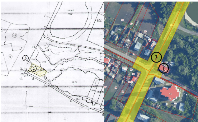
СХЕМА РАСПОЛОЖЕНИЯ ЗЕМЕЛЬНЫХ УЧАСТКОВ, ИМЕЮЩИХ ОБЩУЮ ГРАНИЦУ С ЗЕМЕЛЬНЫМ УЧАСТКОМ С КАДАСТРОВЫМ НОМЕРОМ 63:32:0504012:5011, ПЛОЩАДЬЮ 864 КВ. М., РАСПОЛОЖЕННОГО В ТЕРРИТОРИАЛЬНОЙ ЗОНЕ «МНОГОФУНКЦИОНАЛЬНАЯ ОБЩЕСТВЕННО-ДЕЛОВАЯ ЗОНА (ОД)» ПО АДРЕСУ: САМАРСКАЯ ОБЛАСТЬ, МУНИЦИПАЛЬНЫЙ РАЙОН СТАВРОПОЛЬСКИЙ, СЕЛЬСКОЕ ПОСЕЛЕНИЕ ВЕРХНЕЕ САНЧЕЛЕЕВО, СЕЛО ВЕРХНЕЕ САНЧЕЛЕЕВО, УЛИЦА ВЕЧКАНОВА, ЗЕМЕЛЬНЫЙ УЧАСТОК 53А