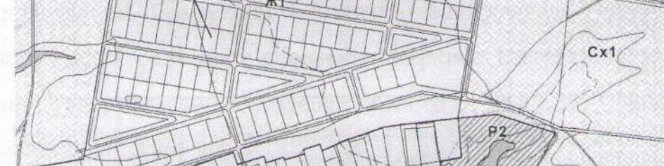
Карта градостроительного зонирования села Верхнее Санчелеево (фрагмент в редакции изменений)

Карта градостроительного зонирования села Верхнее Санчелеево (фрагмент)