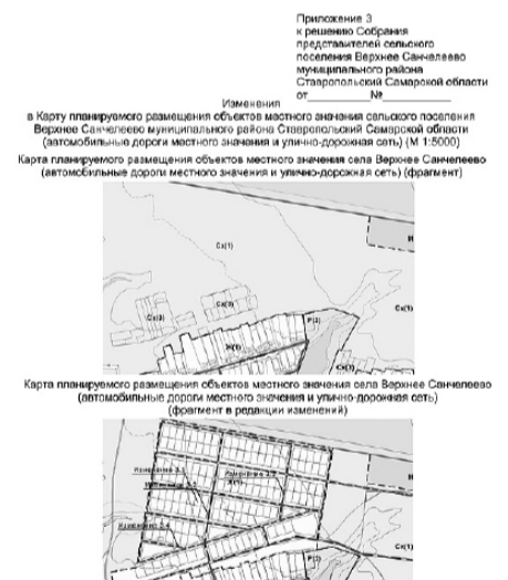
Приложение 3 к решению Собрания представителей сельского поселения Верхнее Санчелево муниципального района Ставропольский Самарской области от №

в Карте планируемого размещения объектов местного значения сельского поселения Верхнее Санчелево муниципального района Ставропольский Самарской области (М 1:5000)