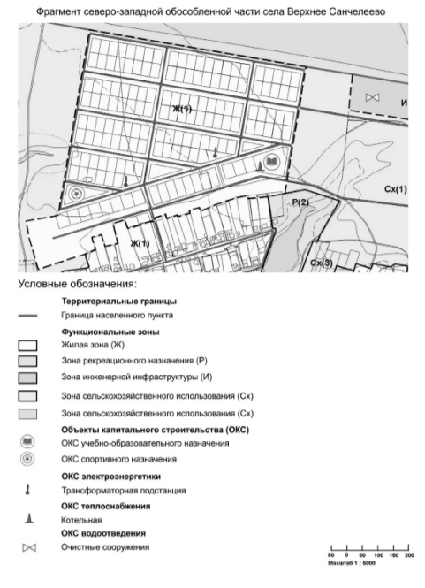
КАРТА МАТЕРИАЛОВ ПО ОБОСНОВАНИЮ ИЗМЕНЕНИЙ В ГЕНЕРАЛЬНЫЙ ПЛАН СЕЛЬСКОГО ПОСЕЛЕНИЯ ВЕРХНЕЕ САНЧЕЛЕВО МУНИЦИПАЛЬНОГО РАЙОНА СТАВРОПОЛЬСКИЙ САМАРСКОЙ ОБЛАСТИ