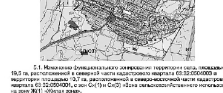
Приложение 5 к решению Собрания представителей сельского поселения Верхнее Санчелево муниципального района Ставропольский Самарской области от №

в Карте функциональных зон сельского поселения Верхнее Санчелево муниципального района Ставропольский Самарской области (М 1:5000)